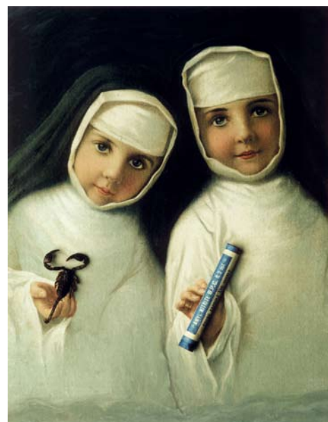
© Christer Strömholm. Mercifull sisters . 1976