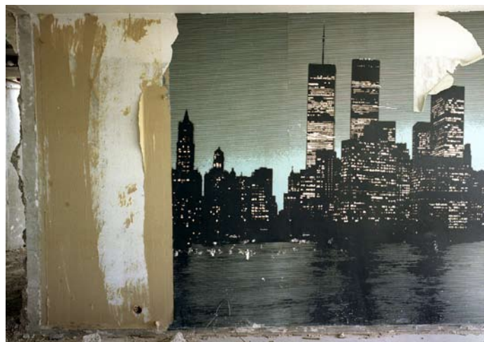
Intérieurs . Gennevilliers 2001