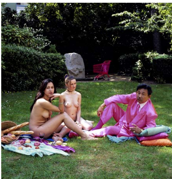
© Manit Sriwanichpoom. La vie en pink #2 . 2004