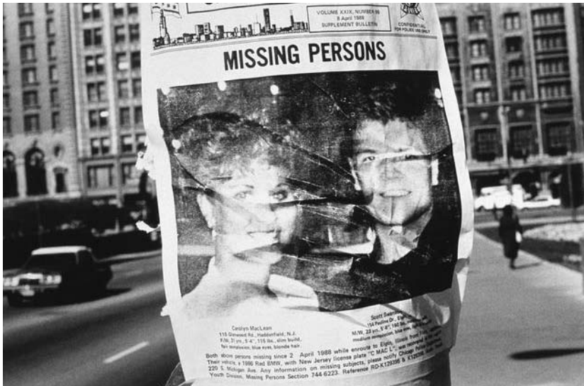
PHOTO GAUCHE : Jeffrey Silverthorne. Chicago 1988. de la série Missing

Rassemblant une centaine d'œuvres de 30 artistes de la Galerie VU', ce parcours inédit suggère des rapprochements entre des photographies très différentes les unes des autres mais qui ont en commun de s'appropriier une image tierce. Des images d'images en quelque sorte, livrées au regard et à la réflexion des visiteurs.