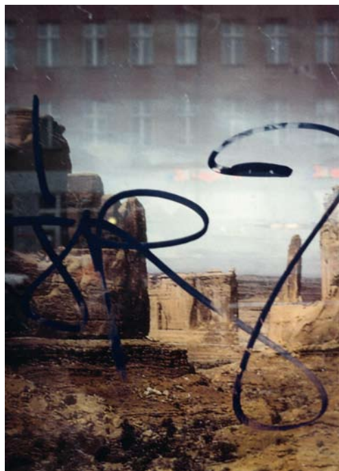
© JH Engström. de la série Haunts