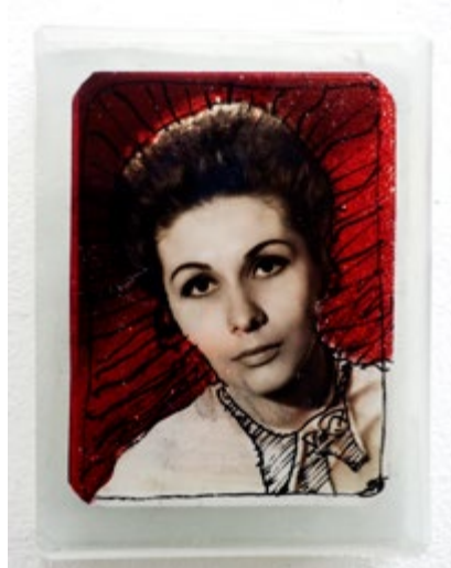
De la série Singer Dreams, 2013