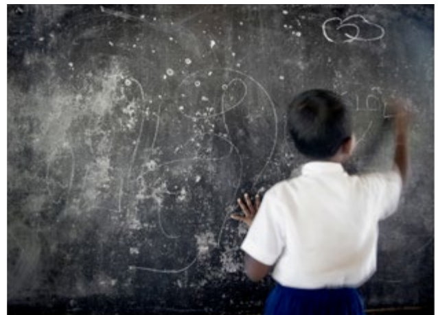
De la série Jaffna, 2012