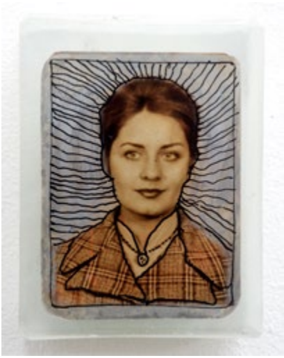
De la série Singer Dreams, 2013

Uniquement dans le cadre de la promotion de l'exposition présentée à la Galerie VU'. Le format de l'image ne peut être supérieur à une demi-page. Autre utilisation, format, autre photo, merci de nous contacter.