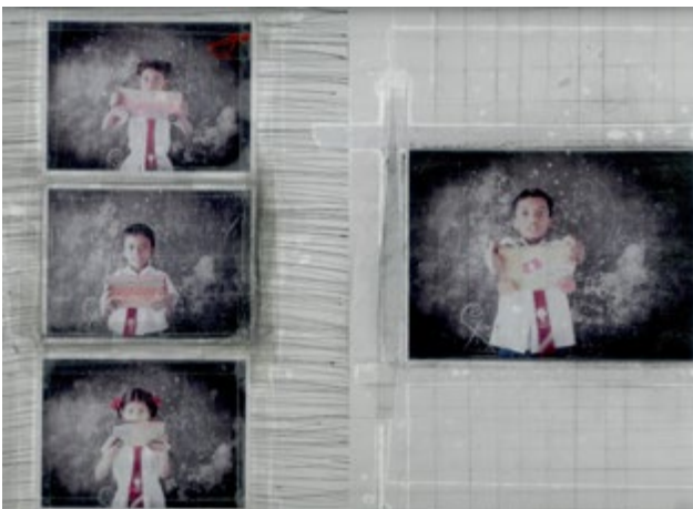
De la série Jaffna, 2012