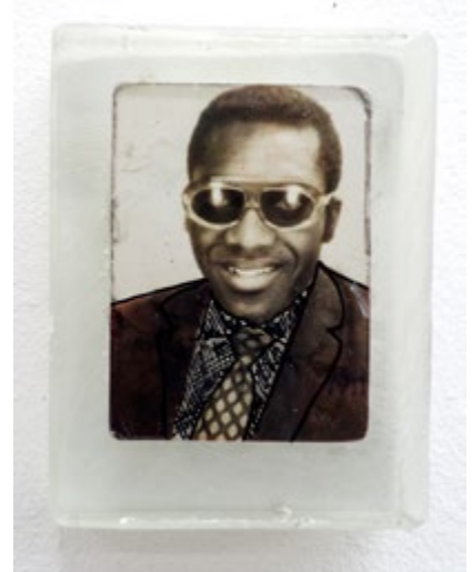
De la série Singer Dreams, 2013