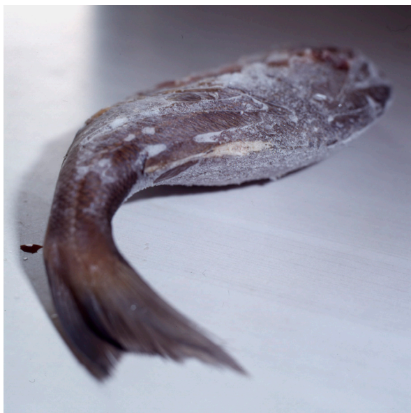
Natures mortes , 1996