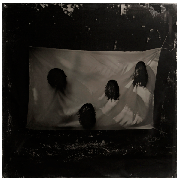
L'écho des choses