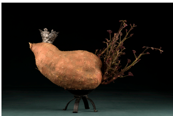
Tu es une merveille, collection belge 2017-2018