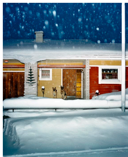
Réf.3/ De la série "Vinter". Kiruna, 2004