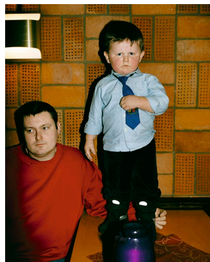
Réf.2 / De la série "Vinter". Sundsvall, 2007