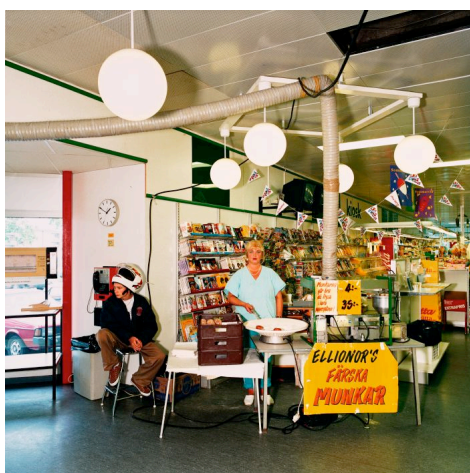
Réf.6/ De la série "I love Borås !". 1989-1996