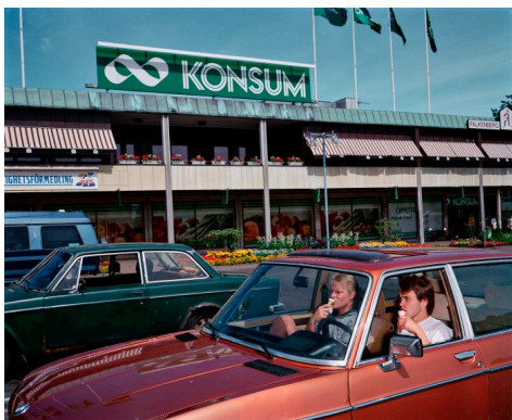
Réf.5/ De la série "I love Borås !". 1989-1996