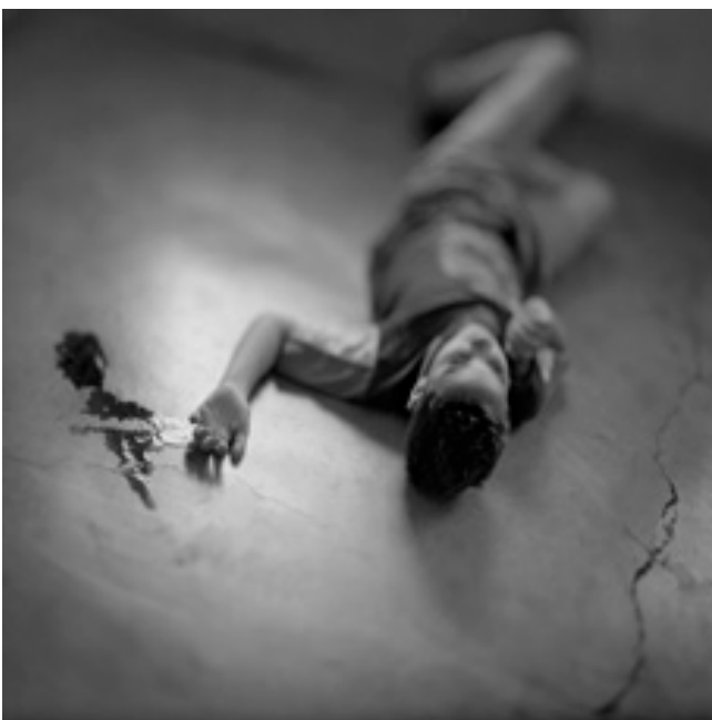
Réf.3 / Salamanca 2002