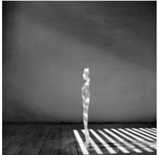
Réf.2 / Cespedosa, 1993