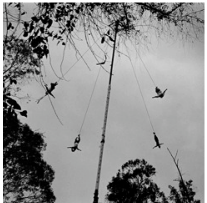
Réf.4 / DF, 2002