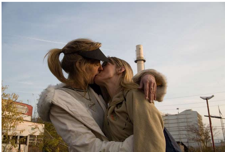
Camden, N. J., 2008