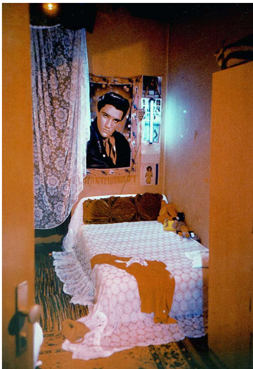
Madones infertiles #06, 1992