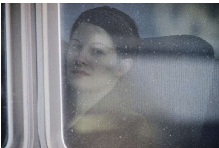
Traffic #18, 1999-2003