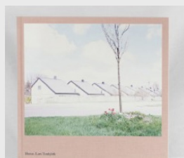
Lars Tunbjörk Home 400,00 €