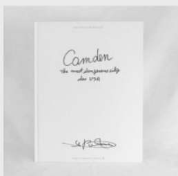
Jean-Christian Bourcart Camden 45,00 €