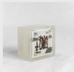
José Ramón Bas Résine Série Ndar, 2008 250,00 €