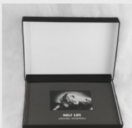
Michael Ackerman Coffret édition spéciale... 550,00 €