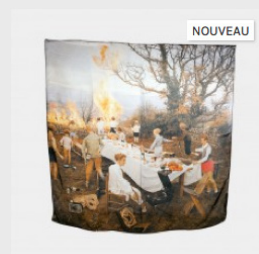
Bernard Faucon Foulard 90,00 €