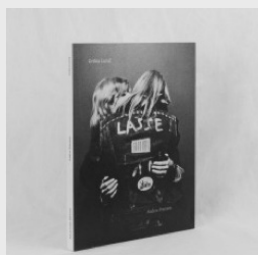
Anders Petersen Edition spéciale Gröna Lund 450,00 €