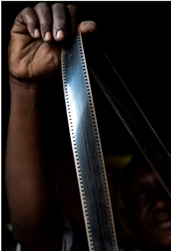
À Màrà ; ce qu'il faut garder en Bambara