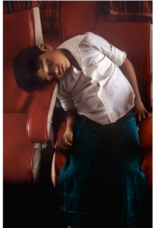
Cusarare, Sierra Tarahumara , Mexique, 2010