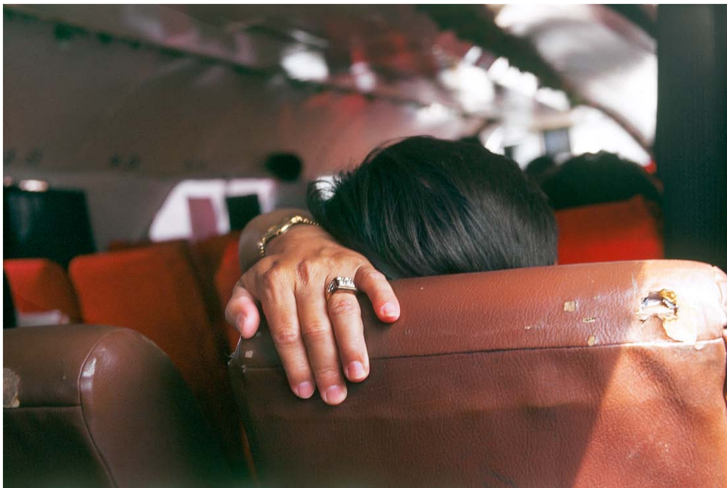
Tonlé Sap, 1998

6 avril – 19 mai 2012 / lundi – samedi, 14h – 19h