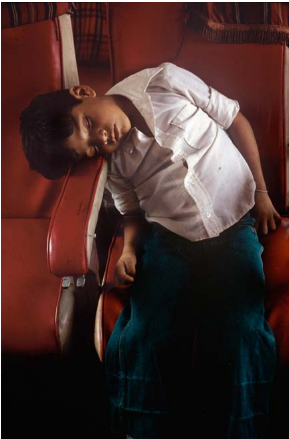
Baranquilla, Colombie, 1980

« Le vrai bonheur serait de se souvenir du présent. » Jules Renard