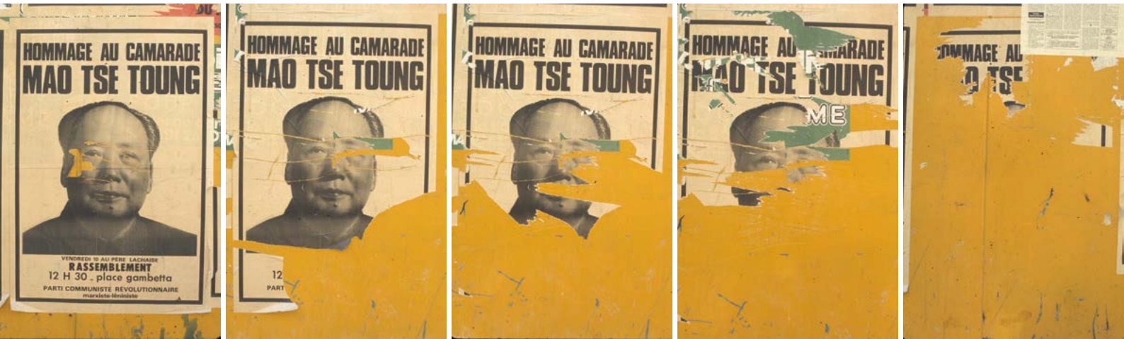
Bye-Bye Mao! Paris, 1976