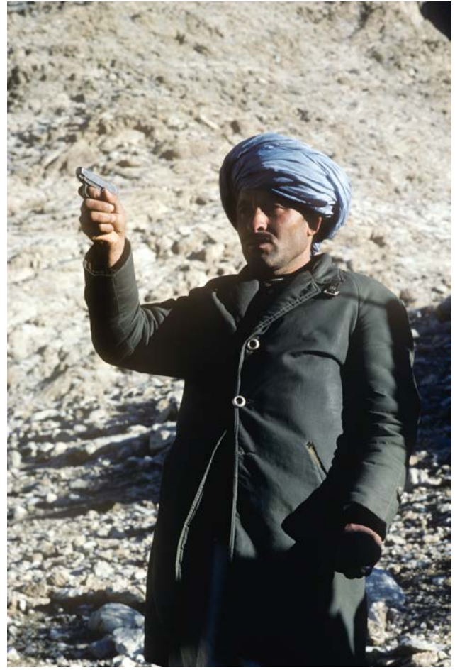
Résistant III, Afghanistan, 1980