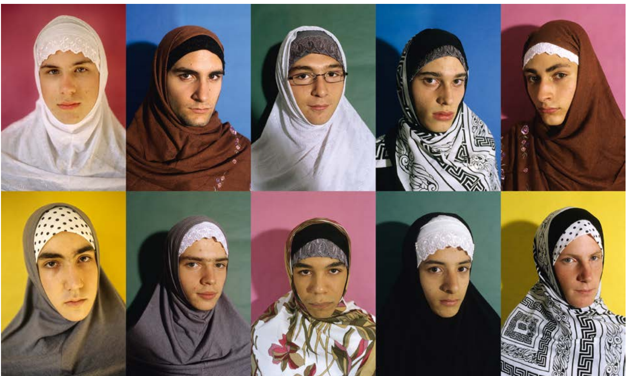
Liberté, Egalité, Fraternité, 2004