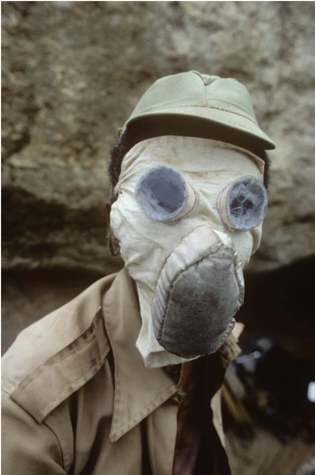
Masque V, Erythée, 1982