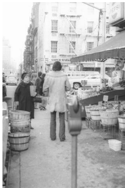
Vol d'une pomme, New York, 1970 Le propriétaire de l'œuvre peut être inculpé de complicité d'apologie de vol