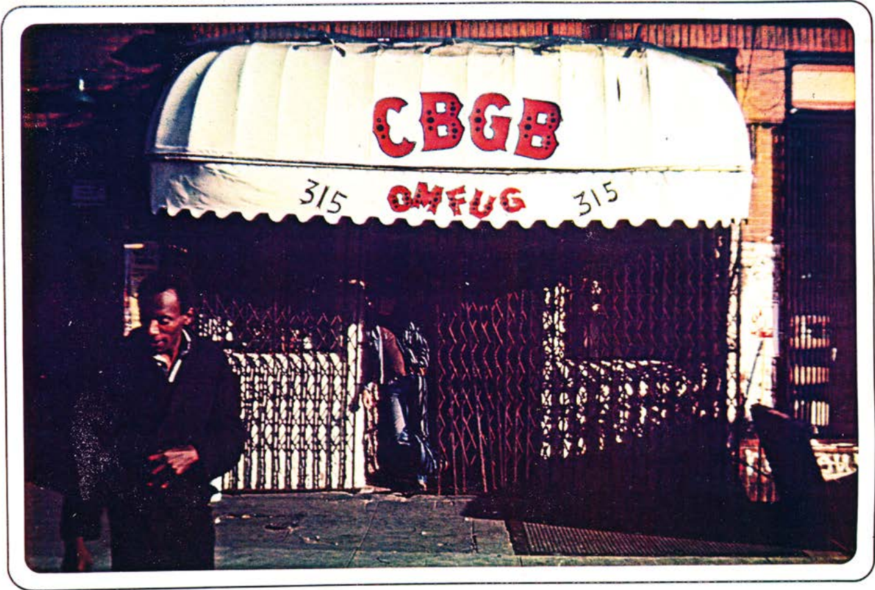
CBGB's, New York, de la série Xerox 70's Photocopie Xerox à partir d'une diapositive