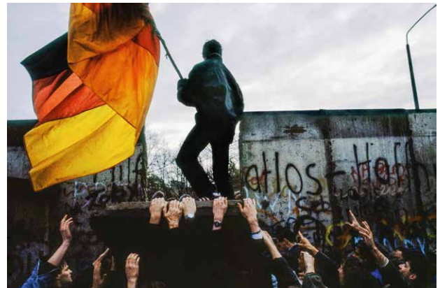
Berlin, 10 novembre 1989.