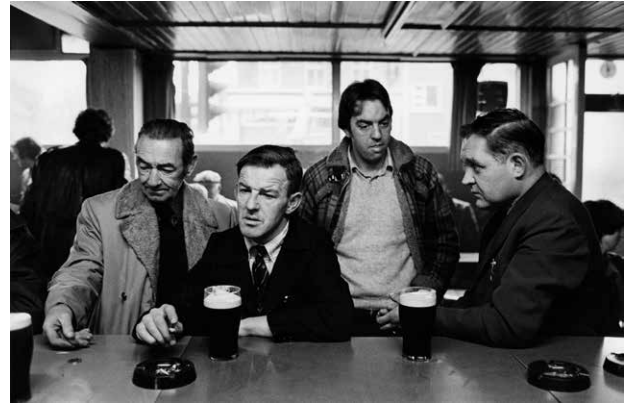
Dublin, 1981.