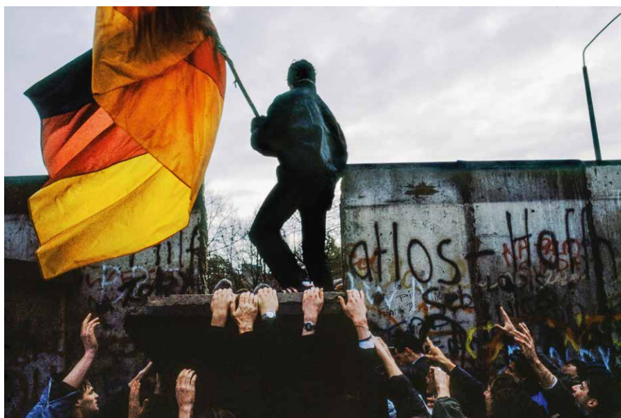
Berlin, 10 novembre 1989.

Caroline Parent et Christian Caujolle, "Terminus Nord", Photo-romans, La Sept/INA/Coup d'oeil, 15'.