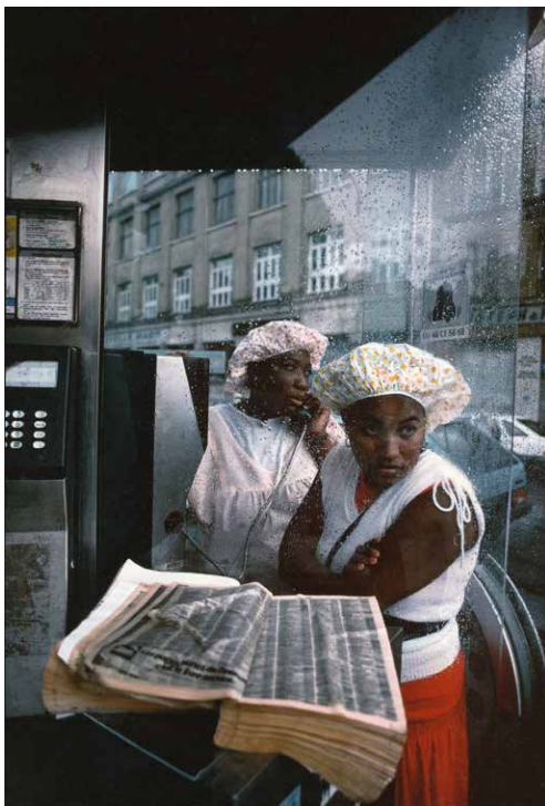
Îlot Chalon, Paris, 1988.