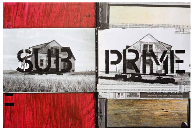
Tentative d'épuisement d'un livre, Unknown II, 2009-2017.