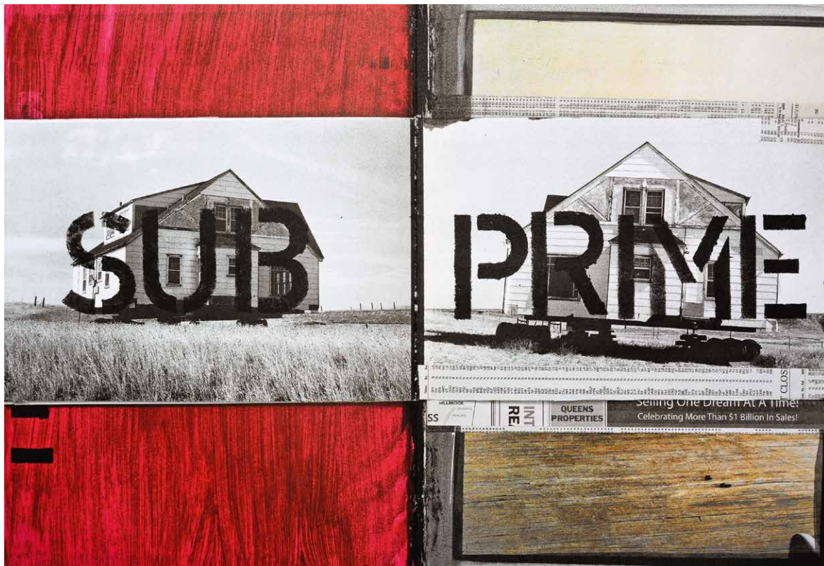
Tentative d'épuisement d'un livre, Unknown II, 2009-2017.

Métamorphose. La photographie en France 1968-1989 , Pavillon populaire, Montpellier.