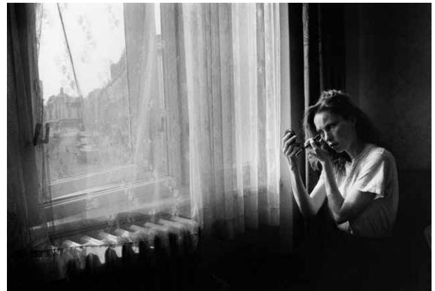
Tala, Hradec Králové, 1991.