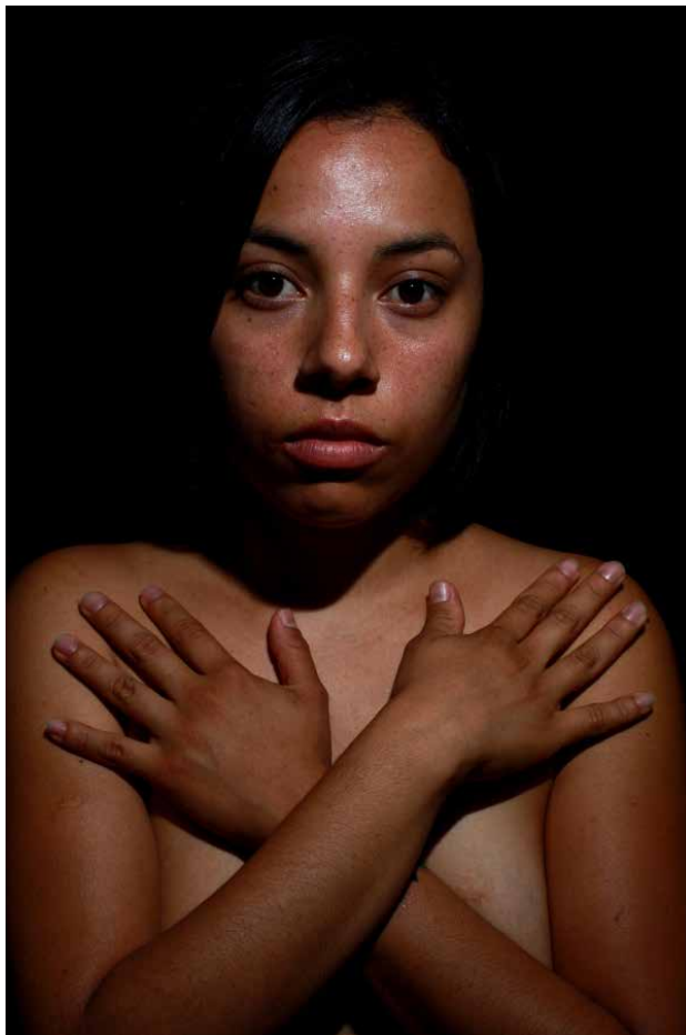
Xilonen , de la série La dérivée mexicaine

Par l'affleurement du passé dans le contemporain et le photographique, les images de ces trois séries suscitent les vertiges de différents temps superposés visibles simultanément. Un des enjeux de cette approche est de rejoindre, en tant que pur plasticien, une voie que l'on pourrait qualifier de documentaire par le contenu de chaque image, chacune renvoyant à des faits historiques ou mythologiques précis dans différentes temporalités, chargée de plusieurs strates de références qui glissent et échappent à première vue. Aussi, ces photographies condensent des formes de télescopes spatio-temporels, qui en plus de la forte impression ressentie physiquement, stimule intellectuellement celui qui les regarde.