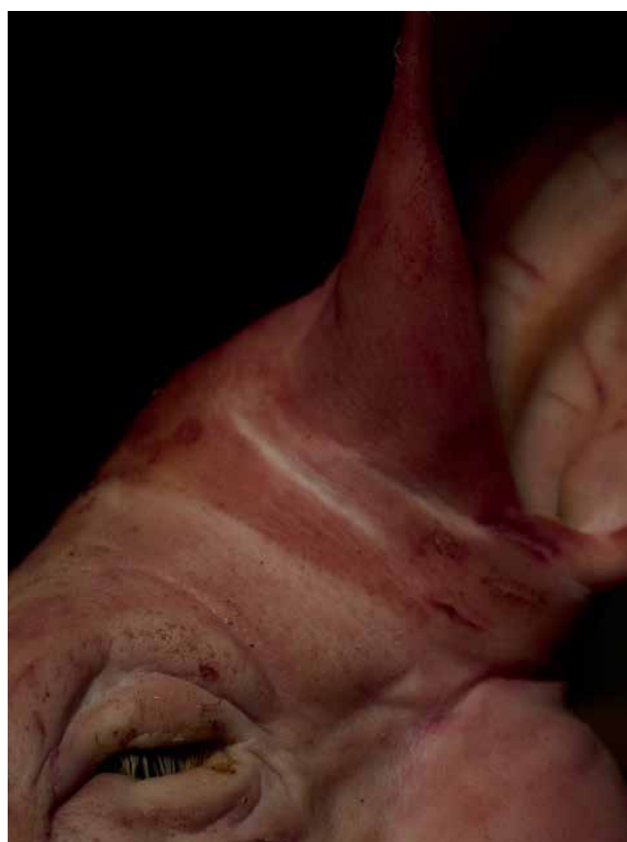
Sæhrímnir , de la série Viking

Noir Limite - Corps à corps , exposition censurée et annulée, Maison de la Culture de Bourges 1987. Les Froissés , Le Parvis, Tarbes Noir Limite , Maison de la Culture, Bourges ; Galleria dell'Imagine, Savignano, Modène, Italie 1985. Cette Femme-là , Maison de la Culture, Rennes ; Galerie Perrain, Paris