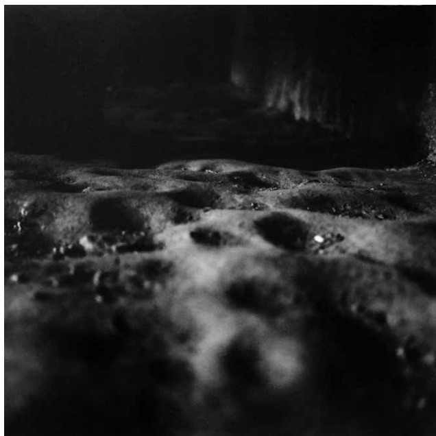
De la série Les paysages celtiques