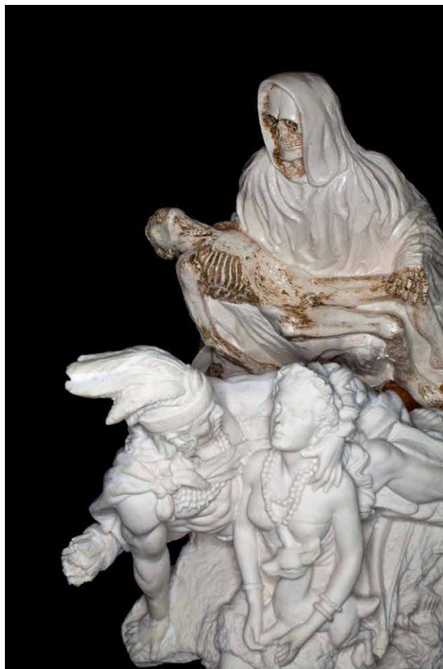
Santa Muerte, Popocatépetl et Iztaccihuatl de la série La dérivée mexicaine