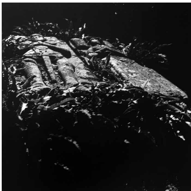
De la série Les paysages celtiques

Bourse Léonard de Vinci pour un séjour en Arizona