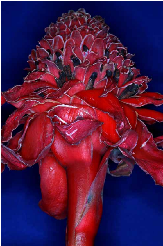
Fleur de Cuetzalán, de la série La dérivée mexicaine